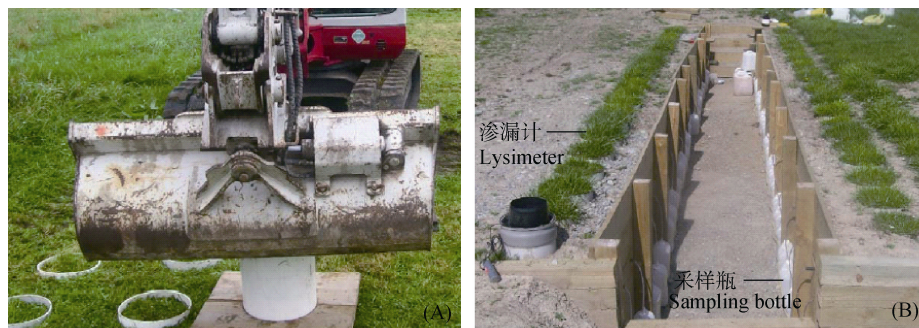
图 1 原状土壤渗漏计的安装(A)及土壤溶液的采集(B) [49]

渗漏计法(lysimeter)，一般为 PVC 或钢质圆筒，安装时将其直接压入土壤，连同圆筒取出完整原状土壤，末端封闭后接出水口，后将其重新埋入土壤 [45] 。原状土壤渗漏计的田间安装也比较复杂(图 1)，很多情况下需要用到大型机械，对试验区土壤扰动较大 [49] 。在安装过程中，须使渗漏计壁与周围土壤紧密结合，并尽量减少人为因素对渗漏计微区环境的影响 [50] 。长期以来，这种方法一直受到沿侧壁下渗的优势流问题的困扰 [46,51] 。另外渗漏计底部也有可能出现阶段性水分饱和，导致反硝化作用的发生，影响了硝态氮的浓度 [32,50] 。通常旱地土壤水分很少能达到饱和。在非饱和条件下，硝态氮随土壤水分在重力势和基质势等作用下仍可能缓慢向下迁移。此时，滞留在渗漏盘(计)中的硝态氮则可能发生一系列转化或随着水分向上迁移。在旱地土壤中，一般认为应用渗漏盘(计)法监测溶质通量的结果偏低 [32] 。